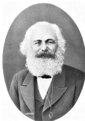
Karl Marx, Alger, les 27 et 28 avril 1882