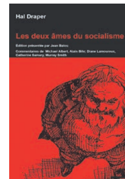
Hal Draper, Les deux âmes du socialisme , Paris, Syllepse, 2008.

staliniennes – qui se sont revendiquées (abusivement) du marxisme, mais aussi l'incapacité des mouvements anti-systémiques des années 1968 à changer réellement cette donne, marque en profondeur le cadre culturellement régressif de l'époque actuelle, où il est devenu plus facile de penser la fin du monde que la fin du capitalisme (pour reprendre une formule bien connue du philosophe états-unien Fredric Jameson).