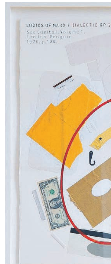
Ralph Paine, collage de la série

longues périodes de rotation rendent la culture des forêts impropre à l'exploitation privée et par conséquent à l'exploitation capitaliste, qui est essentiellement privée, même si le capitaliste isolé est remplacé par des capitalistes associés. Le développement de la culture et de l'industrie en général a toujours tellement contribué à la destruction des forêts que tout ce qui a été fait pour les conserver et pour les produire, est absolument négligeable. »