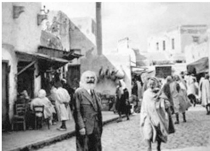
Karl Marx, Alger, avril 1882

Ses réflexions sur le livre de Lewis Henry Morgan, Ancient