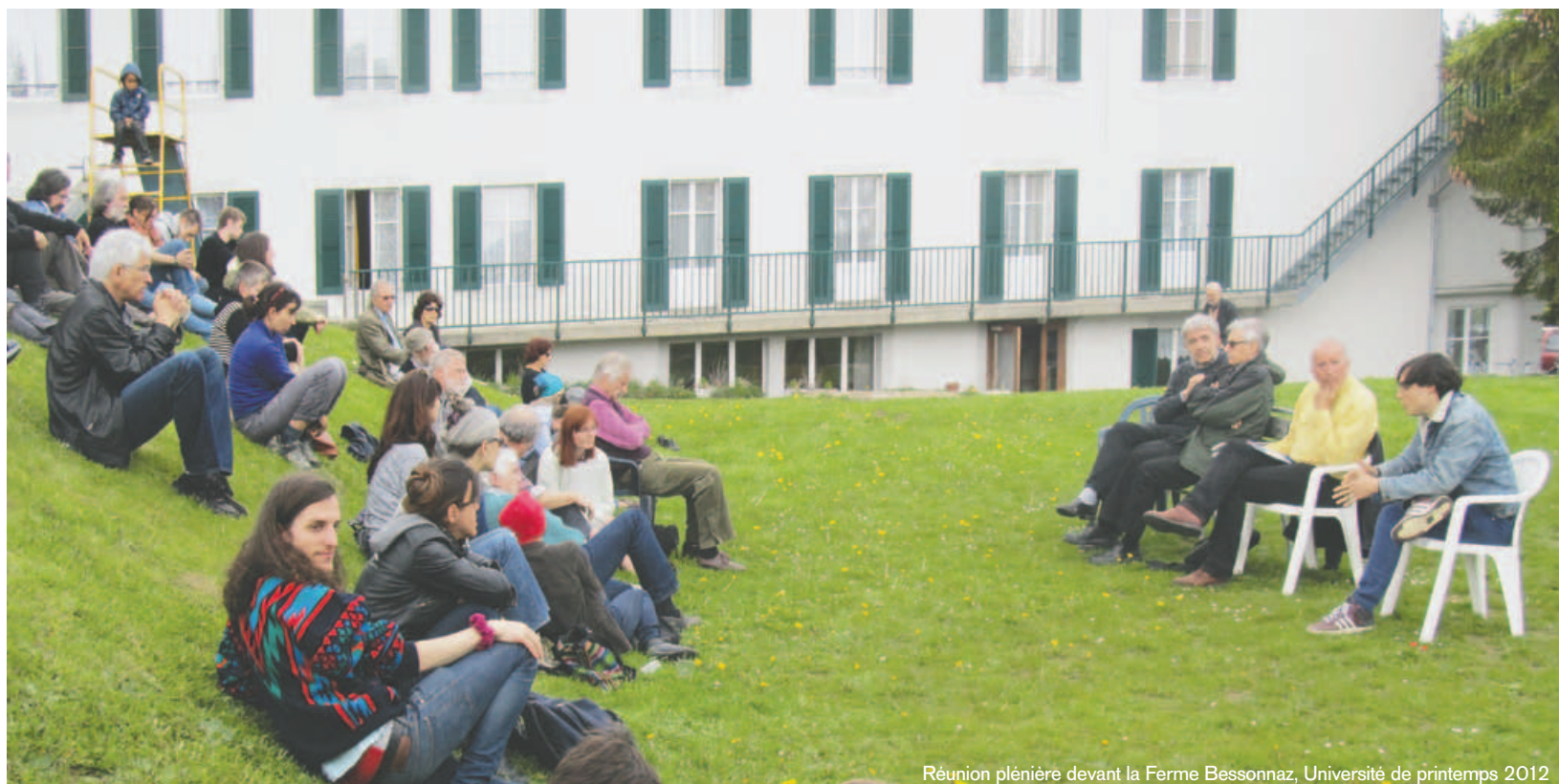
Réunion plénière devant la Ferme Bessonnaz, Université de printemps 2012