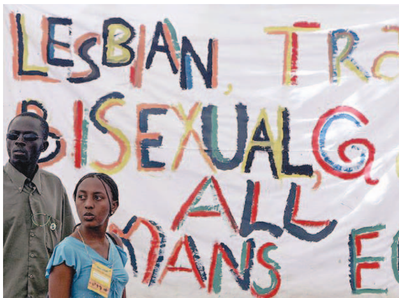
Manifestation contre l'homophobie en Ouganda