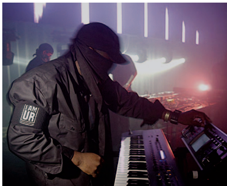
Concert du groupe Underground Resistance (Detroit)