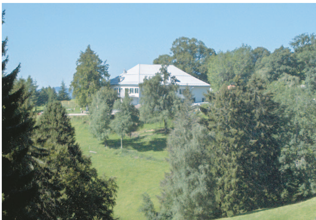
La Ferme La Bessonnaz

et un premier tour de réactions des militant·e·s français présents