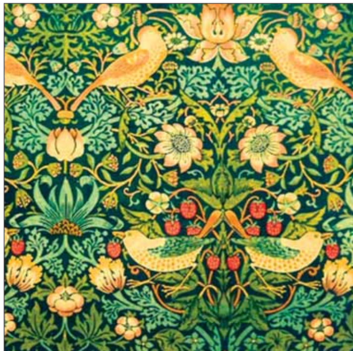
«La cause de l'art, c'est la cause du peuple...» Papier peint de W. Morris DR

[...] Nous avons laissé tomber l'Art pour ce que nous pensions être les lumières et la liberté. Mais nous avons obtenu moins que les lumières et la liberté: les lumières ont montré beaucoup de choses à ceux des nantis qui se souciaient de les rechercher: la liberté les rendait assez libres pour autant qu'ils se soucient de faire usage de leur liberté; mais dans le meilleur des cas, ils étaient peu